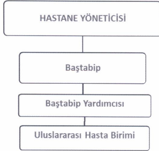
Şema 4: Sağlık Tesisi Organizasyon Yapısı.

Uluslararası Hasta Birimi'nde Sağlık Hizmetleri Sınıfından 1 (bir) Birim Sorumlusu görev alır. Birim sorumlusu, Hastane Yöneticisi tarafından aşağıdaki niteliklere uygun kişiler arasından seçilerek istihdam edilir. İhtiyaç doğrultusunda Uluslararası Hasta Rehberleri istihdam edilebilir.