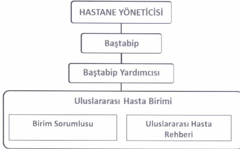
Şema 2: Sağlık Tesisi Organizasyon Yapısı.

(1) Hastane Yöneticisinin uygun görmesi kaydıyla, ihtiyaç hallerinde ilave personel istihdamı sağlanabilir. Hastane yönetimi sağlık tesisinde uluslararası hasta birimi için fiziki şartları ve teknik donanımını hazırlar.