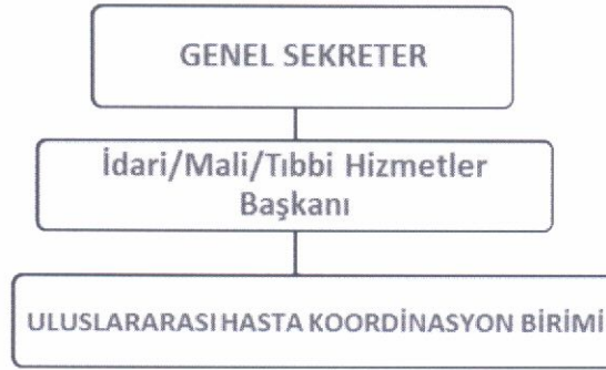
Şema 3: Organizasyon Yapısı.

Genel Sekreterin uygun gördüğü Başkanlardan birine bağlı olarak sağlık turizmi faaliyetleri yürütülür. Sağlık Hizmetleri Sınıfından 1 (bir) kişi, Uluslararası Hasta Koordinasyon Birimi sorumlusu olarak görevlendirilir. Sorumlu olarak görevlendirilecek kişi aşağıda belirtilen niteliklere haiz olmalıdır. Bu birimlerde, ihtiyaca binaen personel istihdam edilebilir.